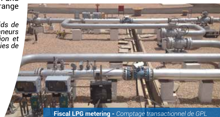
Fiscal LPG metering - Comptage transactionnel de GPL