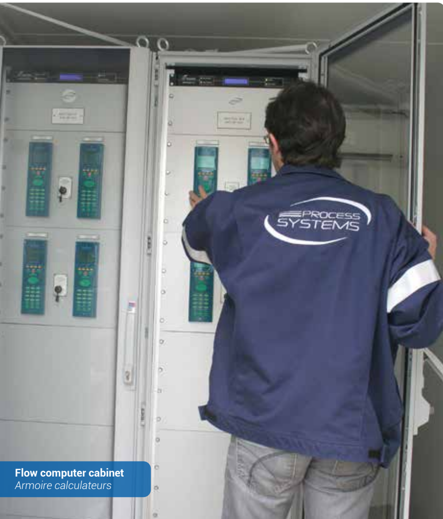
Flow computer cabinet Armoire calculateurs