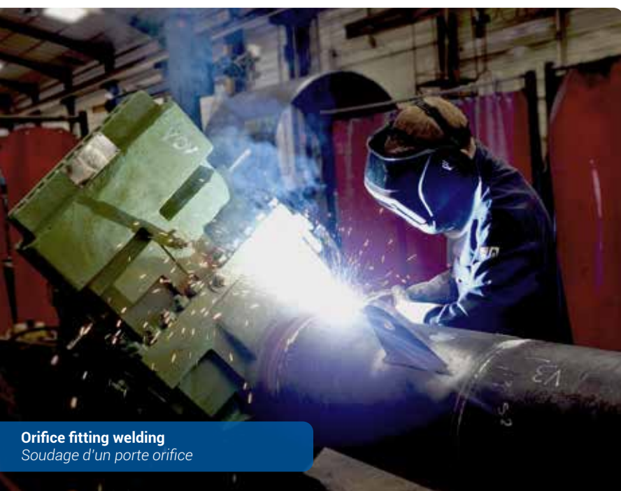
Orifice fitting welding Soudage d'un porte orifice