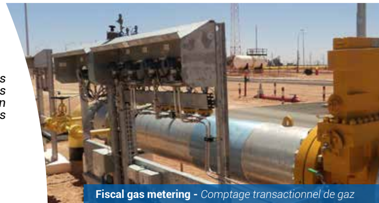
Fiscal gas metering - Comptage transactionnel de gaz