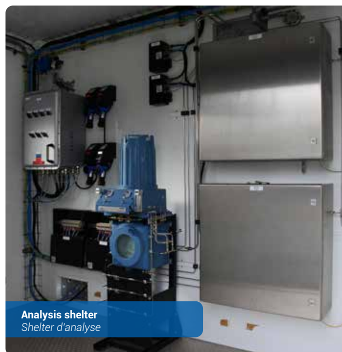
Analysis shelter Shelter d'analyse