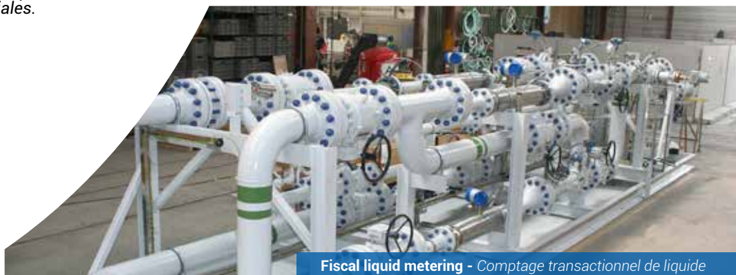
Fiscal liquid metering - Comptage transactionnel de liquide