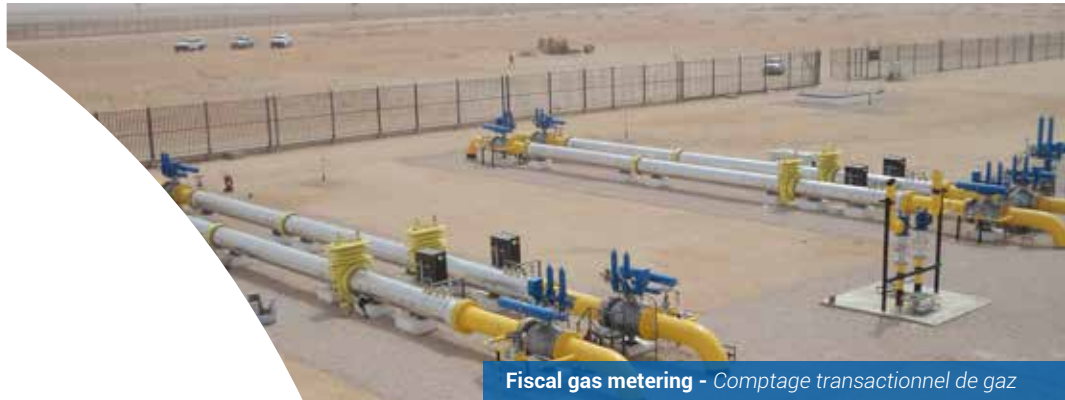
Fiscal gas metering - Comptage transactionnel de gaz

Produits de comptage transactionnel tels que des portes orifices, des débitmètres massiques ou ultrasoniques et des turbines certifiées pour des transactions commerciales.