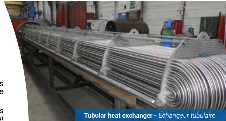
Tubular heat exchanger - Échangeur tubulaire