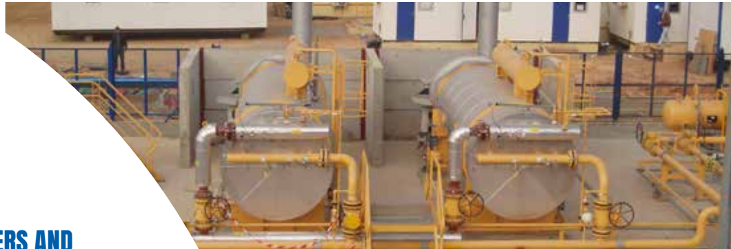
Water bath heaters for gas - Réchauffeurs à bain d'eau pour le gaz

Équipements nécessaires à la production et à la distribution de fluides énergétiques véhiculant une source froide ou une source chaude requise par les équipements de sites industriels.