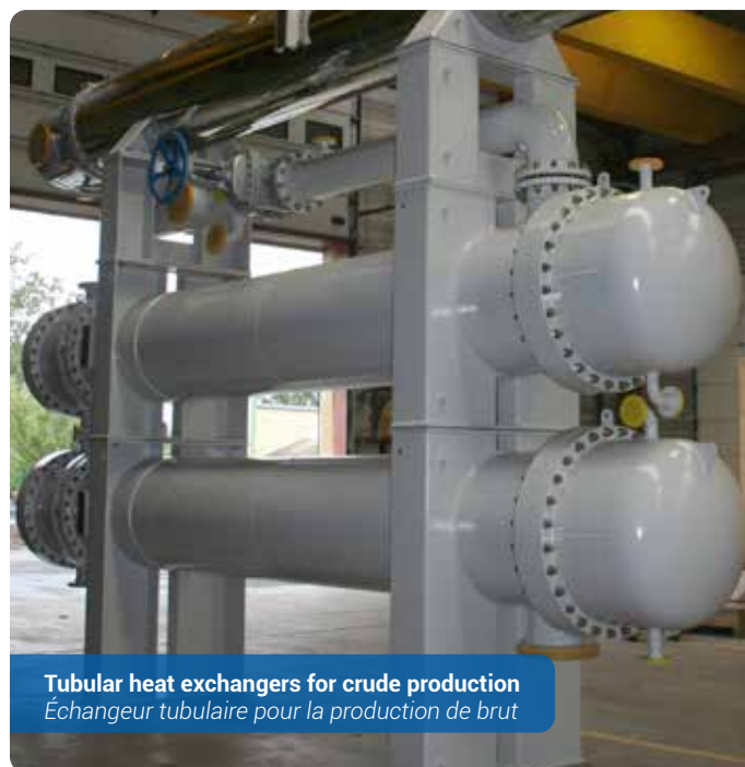
Tubular heat exchangers for crude production Échangeur tubulaire pour la production de brut