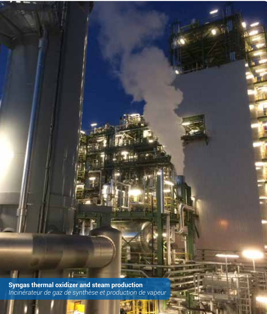
Syngas thermal oxidizer and steam production Incinérateur de gaz de synthèse et production de vapeur