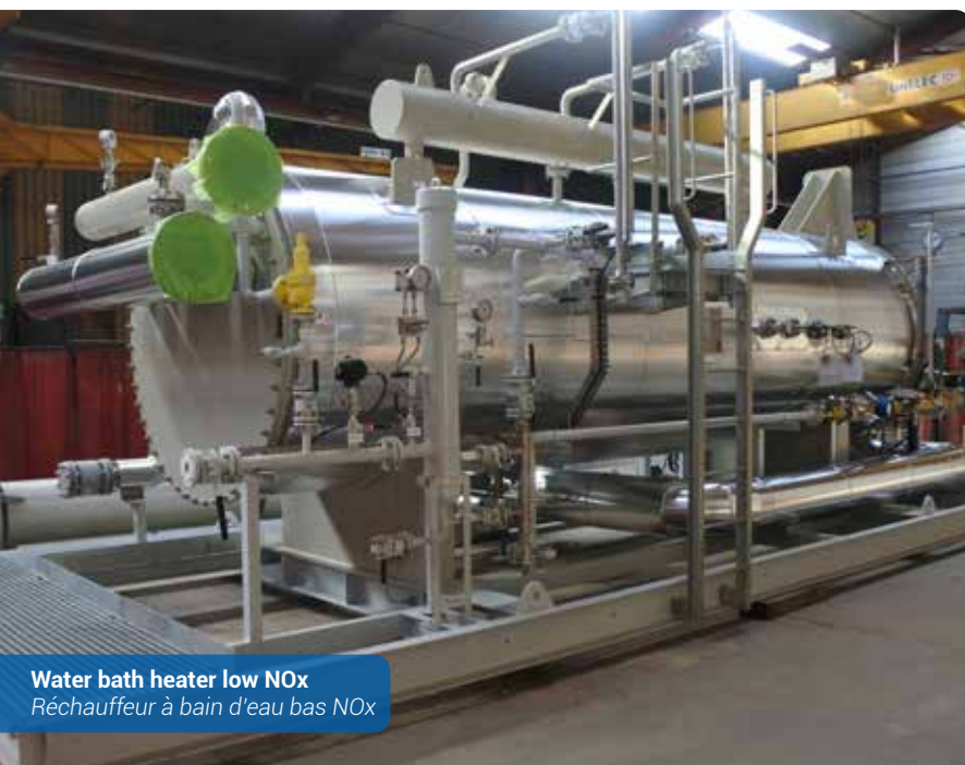
Water bath heater low NOx Réchauffeur à bain d'eau bas NOx