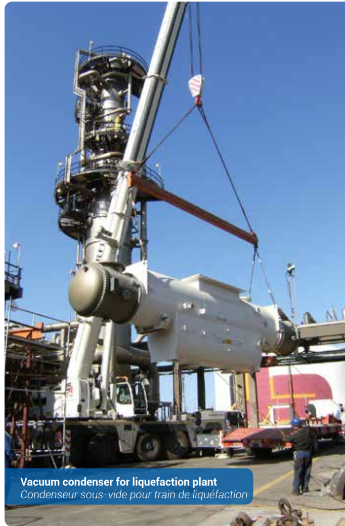
Vacuum condenser for liquefaction plant Condenseur sous-vide pour train de liquéfaction