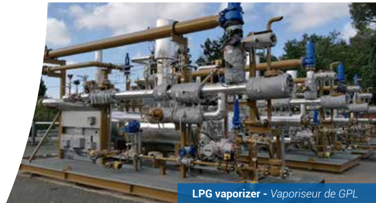
LPG vaporizer - Vaporiseur de GPL